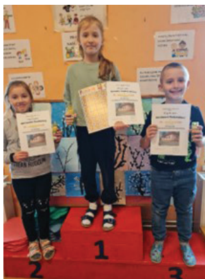
Návrh poštovej známky